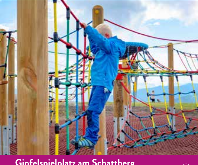
Gipfelspielplatz am Schattberg Summit Playground at Schattberg