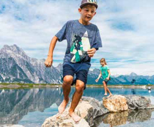
Berg der Sinne | Mountain of Senses