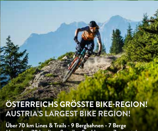
ÖSTERREICHS GRÖSSTE BIKE-REGION! AUSTRIA'S LARGEST BIKE REGION! Über 70 km Lines & Trails - 9 Bergbahnen - 7 Berge More than 70 km lines & trails - 9 cable cars - 7 mountains