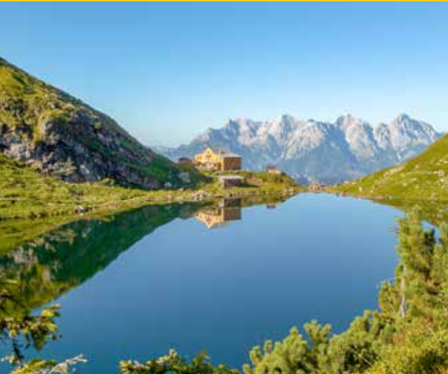
Wildseelodersee | Wildseeloder Lake