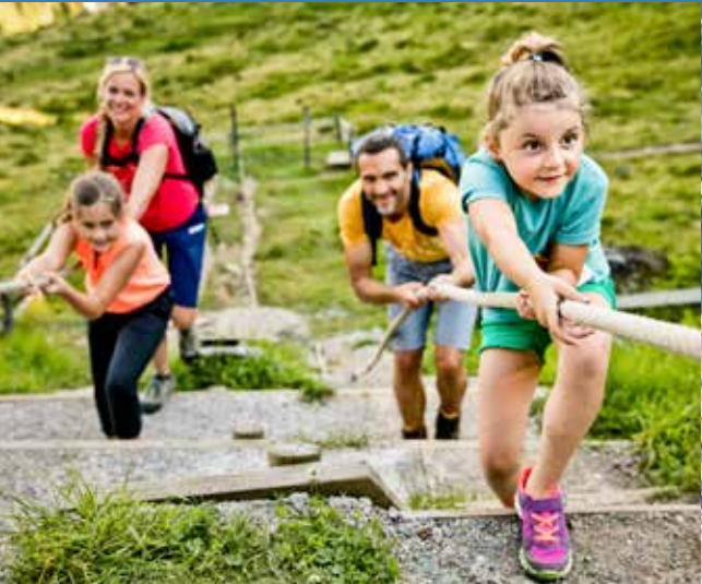
Berg Kodok | Kodok Mountain