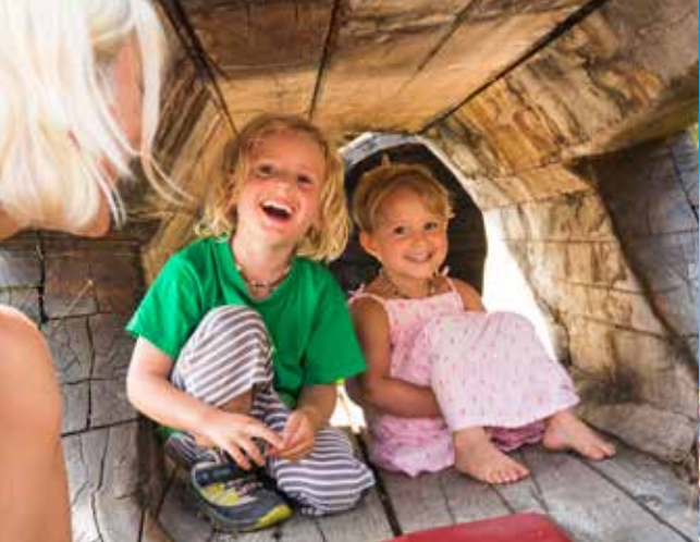
Montelino's Erlebnisweg Montelino's Adventure Path