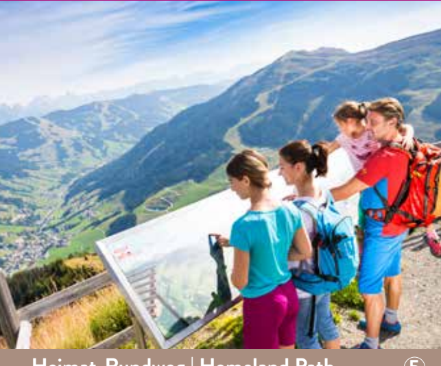
Heimat-Rundweg | Homeland Path