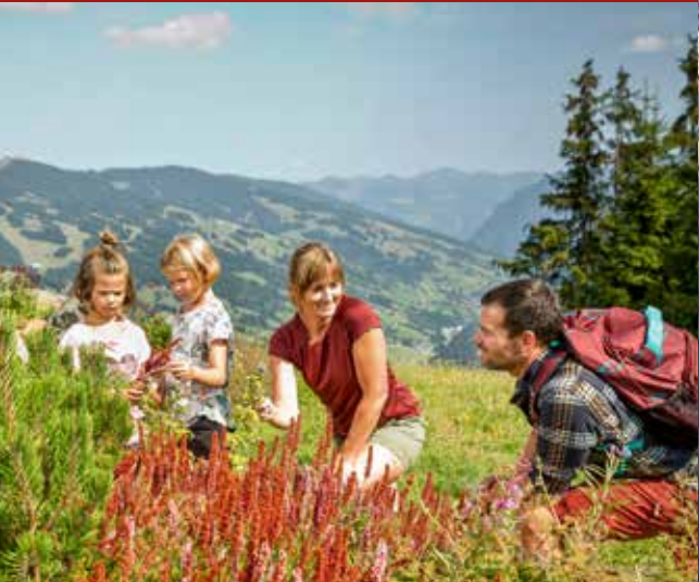
Heilkräuterweg | Medicinal Herbal Trail