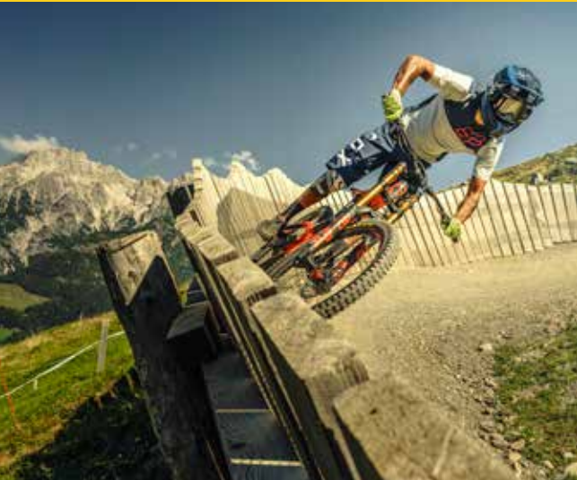
The Epic Bikepark Leogang