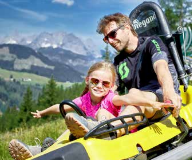
Timoks Wilde Welt | Timok's Wild World